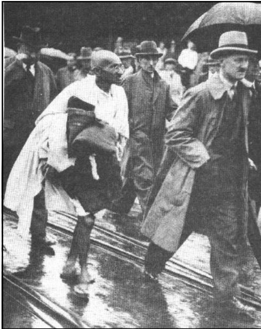
Gandhiji débarquant à Folkestone en Angleterre le 12 septembre 1932 avec son châle et sa provision de coton. Gandhiji refusera de porter des vêtements occidentaux.

"Les valeurs occidentales sont les valeurs occidentales. Les valeurs hindoues sont les valeurs universelles." (Jay DUBASHI)