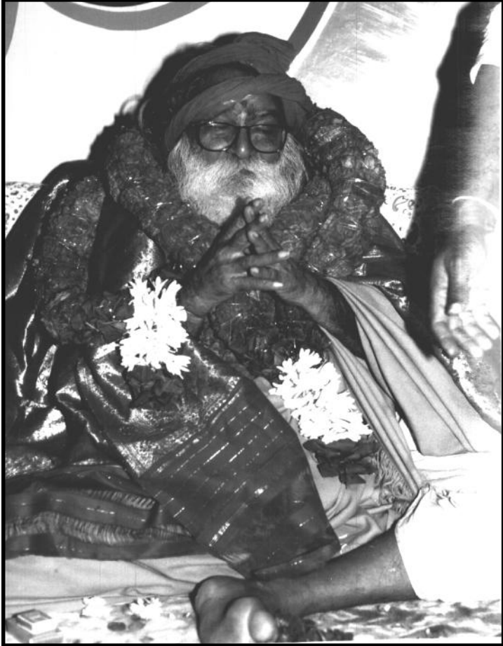
Yogiji couvert de fleurs et de châles le jour du Dipam (5 décembre 1995)